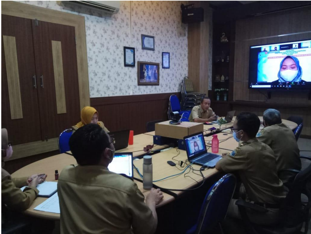
Bimbingan teknis Penguatan Kelembagaan PPID Pembantu dengan tema “Peningkatan kualitas pelayanan PPID Pemerintah Kota Probolinggo” melalui Zoom meeting Tanggal 5 Mei 2020