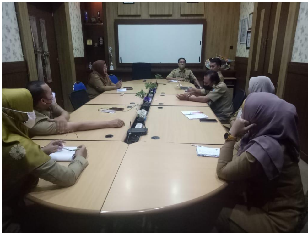
Rapat koordinasi dengan unsur PPID Utama dalam rangka persiapan pemeringkatan badan publik terkait keterbukaan informasi publik di lingkungan Pemerintah Kota Probolinggo bertempat di kantor Diskominfo Kota Probolinggo Tanggal 12 Agustus 2020.